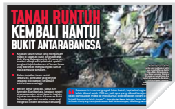
Keratan Sinar Harian semalam.