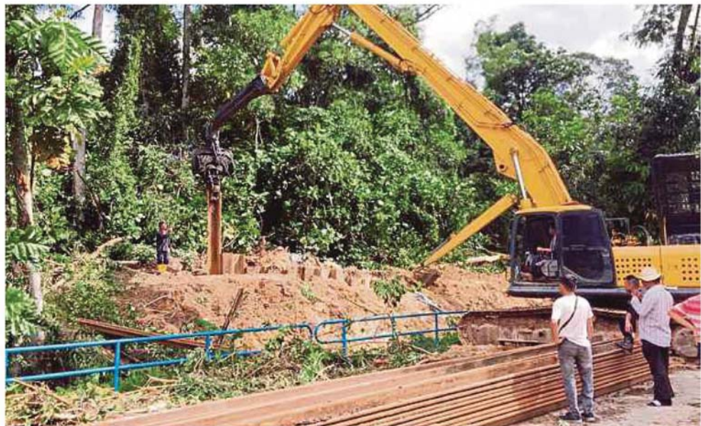
Remedial work being carried out at Jalan Kelab Ukay 4 in Bukit Antarabangsa, which was affected by a landslide

"Unfortunately, at the moment, we do not have any special budget for it but we will coordinate with all local authorities. We are also coordinating with the Selan-