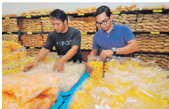
Gabungan Malaysia berpendapat usahawan mikro memerlukan bantuan kewangan untuk meneruskan perniagaan berbanding beralih ke bisnes baharu.