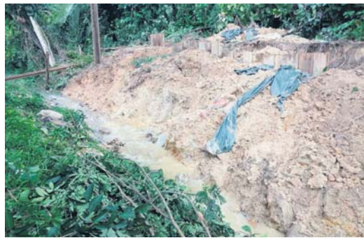
Runtuhan yang berlaku di Jalan Kelab Ukay 4, Bukit Antarabangsa.

“Saya akan usulkan supaya JPS dapat teruskan pemasangan cerucuk hingga ke hujung sungai yang jaraknya kira-kira 100 meter bagi mengelakkan insiden sama berulang,” katanya.