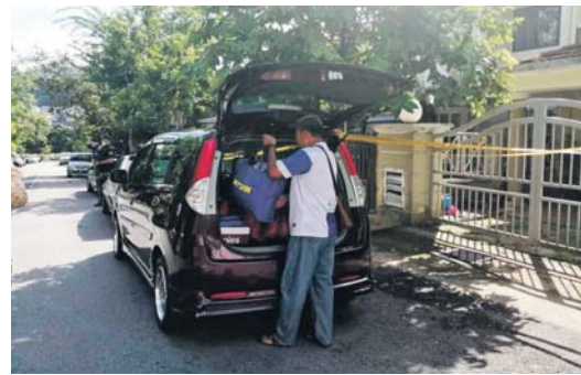
Penduduk pulang seketika ke rumah untuk mengambil keperluan.