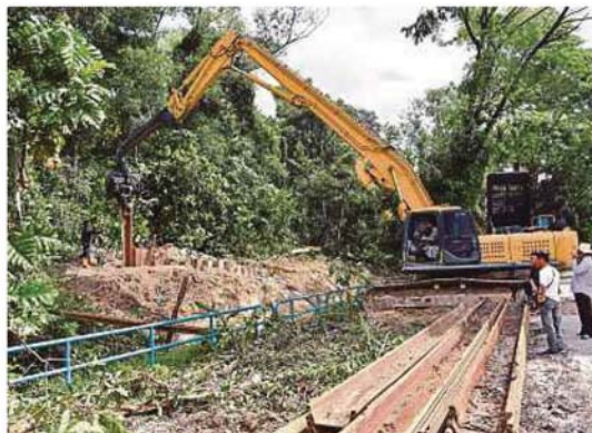
Jentera melakukan kerja pemasangan kepingan besi menghadang pergerakan tanah di tebing anak Sungai Sering.

"Anggota kita akan bergegas ke kawasan itu jika hujan lebat melebihi setengah jam. Rondaan lain juga akan diadakan di kawasan cerun serta berisiko dilanda banjir kilat," katanya kepada BERNAMA.