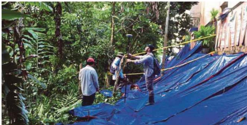
Beberapa juruukur menjalankan tugas pengukuran untuk pelan pembinaan tembok penghadang di belakang kediaman di Taman Kelab Ukay, Bukit Antarabangsa.